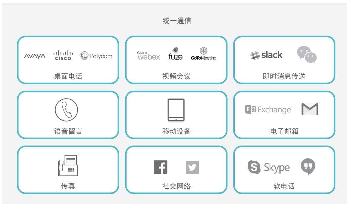
图 1:统一通信 (UC)